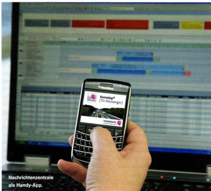
Nachrichtenzentrale als Handy-App.

Der Transport ist ein zentraler Faktor für die Qualität von Milchprodukten. Schon geringe Temperaturschwankungen im Laderaum eines Lkw können die Haltbarkeit und den Geschmack der Lebensmittel negativ beeinflussen. Zur automatischen Überwachung der Temperaturdaten hat nun die Transdata Soft- und Hardware GmbH, Bielefeld ein System entwickelt, das in Echtzeit über kleinste Temperaturabweichungen informiert und diese selbstständig protokolliert.