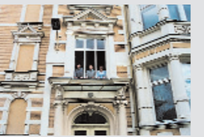
TRANSDATA ist ständig in Bewegung: Eine Zweigstelle in Thüringen eröffnet neue Märkte für das Bielefelder Stammhaus.

1. Juli 1992 Zum vierten Geburtstag erhält TRANSDATA ein neues, frisches Logo, das auch heute noch das unverwechselbare Erkennungszeichen des Unternehmens ist.