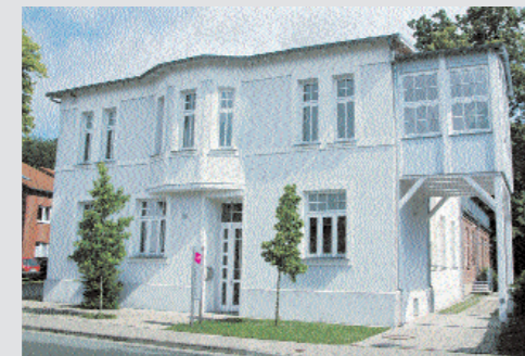
Der ursprüngliche Villencharakter blieb auch nach dem Umbau erhalten. Ein idealer Ort für kreative Ideen.