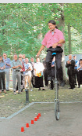
TRANSDATA wächst weiter: Auf einem Tag der offenen Tür (23. August 2001) in Bielefeld präsentiert sich das Unternehmen seinen Kunden.

1. Juni 2000: Im Sommer ist die Welt zu Gast auf der Weitausstellung Expo2000 in Hannover.