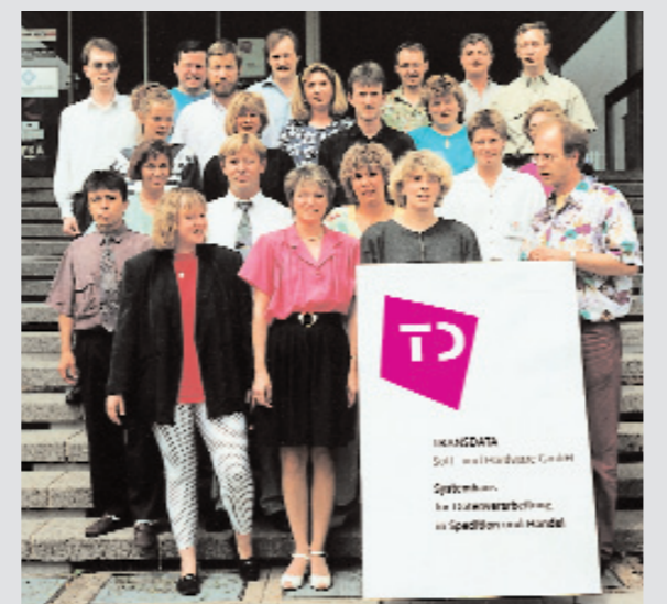
Neues Logo, neues Zuhause, mehr Platz: Rund 25 Mitarbeiter ziehen im Standort Heidsieker Heide ein.

Herbst 1992 Als eines der ersten Unternehmen entwickelt TRANSDATA eine bundesweit gültige Entfernungsauskunft für Güterfernverkehrstarife (GFT).