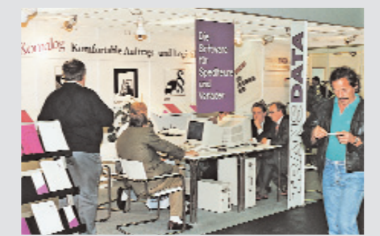
Der erste Messeauftritt. Von Anfang an legte TRANSDATA Wert auf persönliche Kontakte zu ihren Kunden.

20. Juni 1991: Der Bundestag stimmt für Berlin als neuen Parlaments- und Regierungssitz des wiedervereinigten Deutschlands.