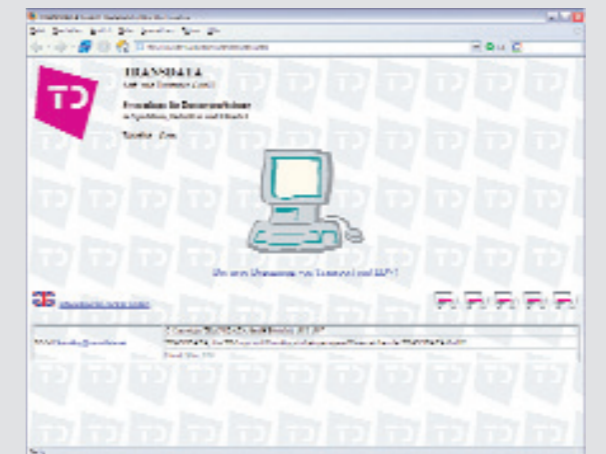
Internet macht's möglich: TRANSDATA ist jetzt 24 Stunden am Tag für seine Kunden präsent.

April 1997 TRANSDATA ist im Internet erreichbar. Unter www.transdata.net eröffnen sich neue Kommunikationswege.